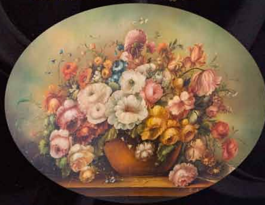
Artista: M. Bruna "fiori"