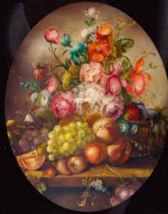
Artista: M. Bruna "natura morta"