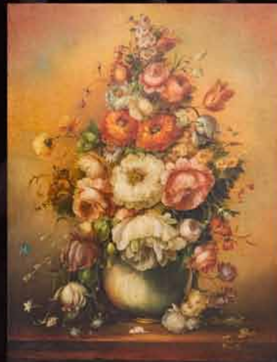
Artista: M. Bruna "fiori"