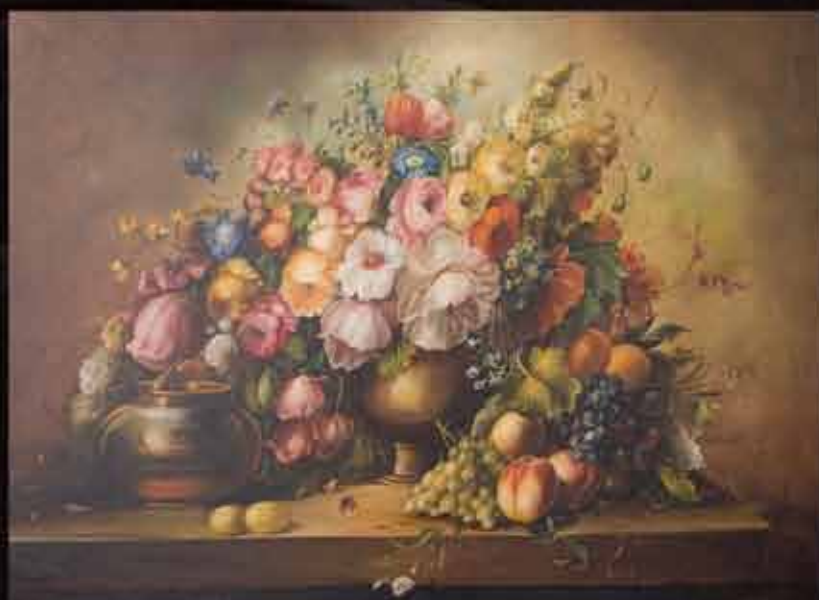
Artista: M. Bruna "natura morta"