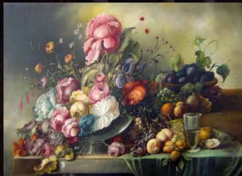
Artista: M. Bruna "natura morta"