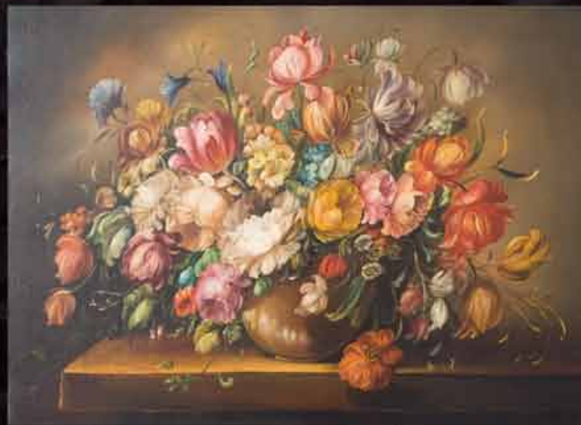
Artista: M. Bruna "fiori"