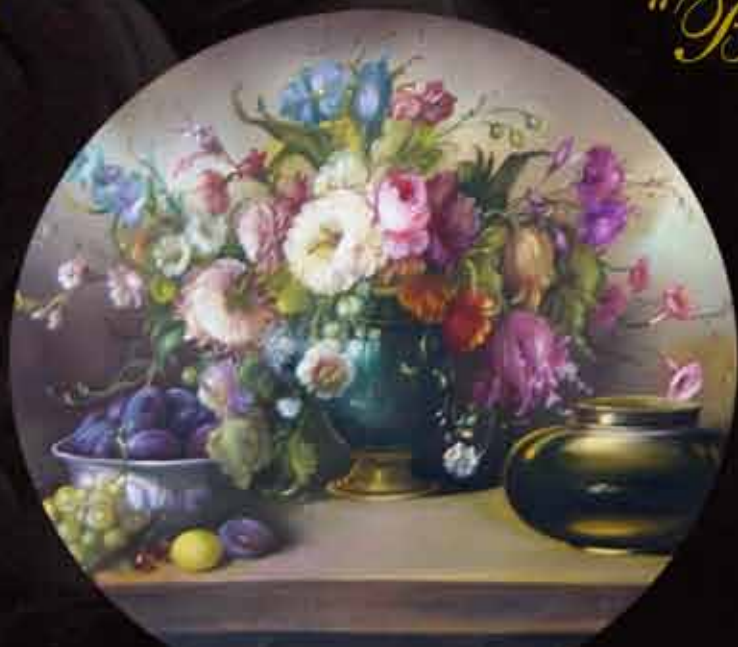
Artista: M. Bruna "natura morta"