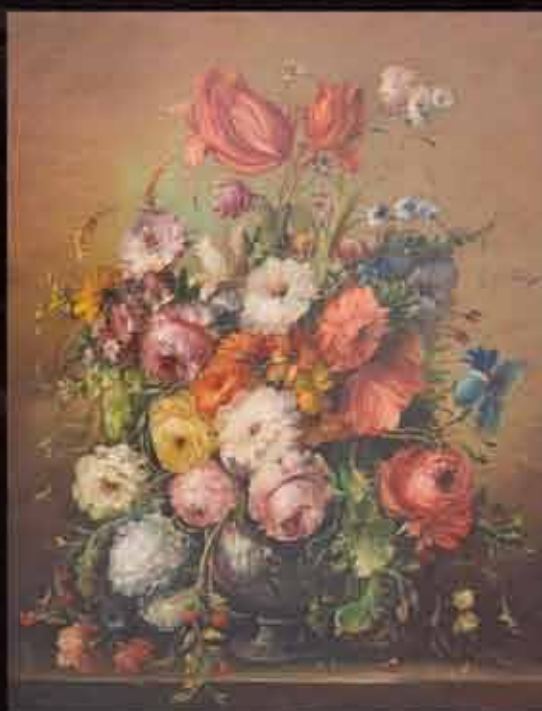
Artista: M. Bruna "fiori"