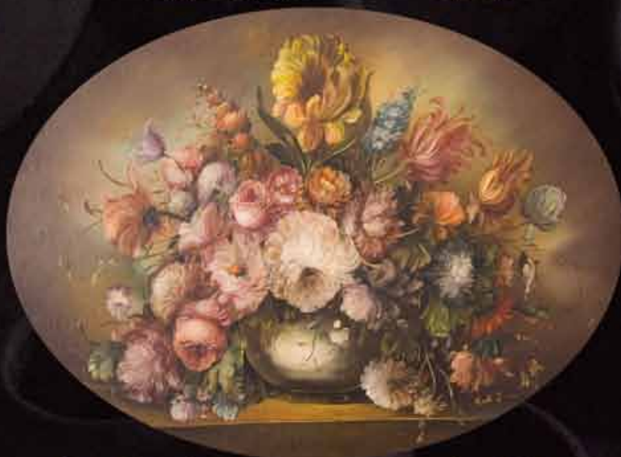
Artista: M. Bruna "fiori"