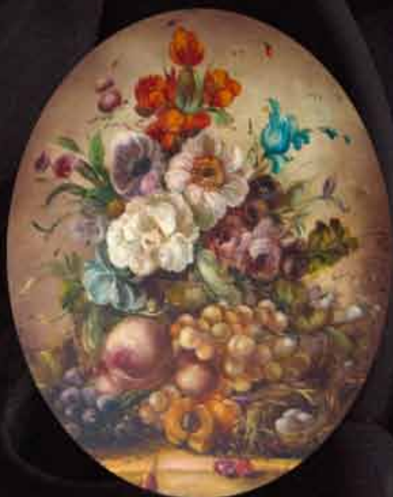
Artista: M. Bruna "natura morta"