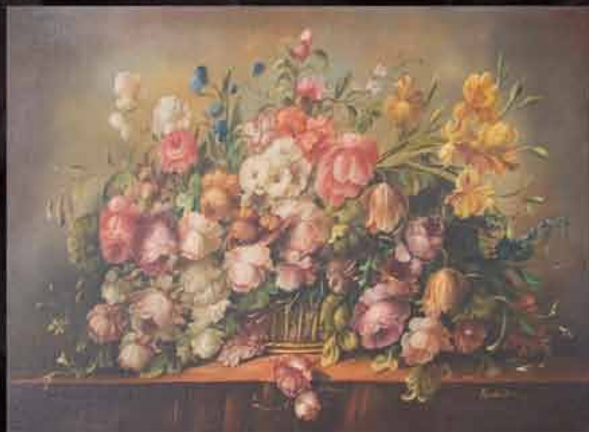
Artista: M. Bruna "fiori"