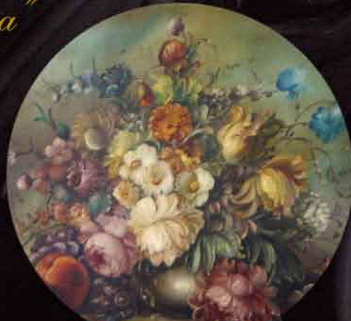
Artista: M. Bruna "natura morta"